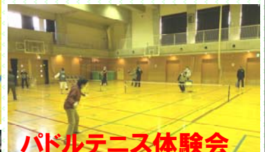
パドルテニス体験会