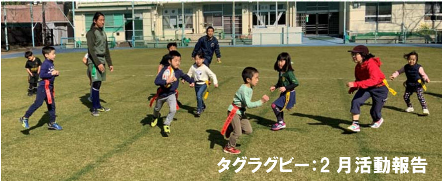
タグラグビー：2月活動報告