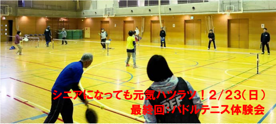
シニアになっても元気ハツラツ！2/23(日) 最終回：パドルテニス体験会

3/1(日)-4/10(金)まで活動中止となりました！！ (新宿区の学校開放中止に伴い)