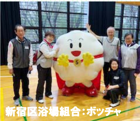
新宿区浴場組合：ポッチャ