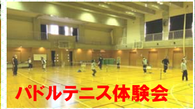
パドルテニス体験会