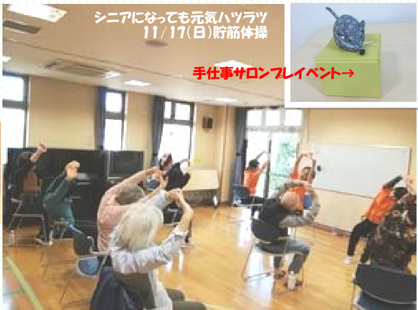
シニアになっても元気ハツラツ 11/17(日)貯筋体操