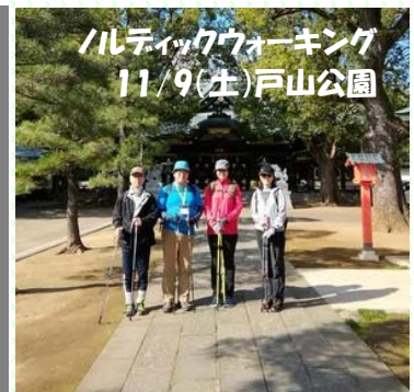
ノルディックウォーキング 11/9(土) 戸山公園