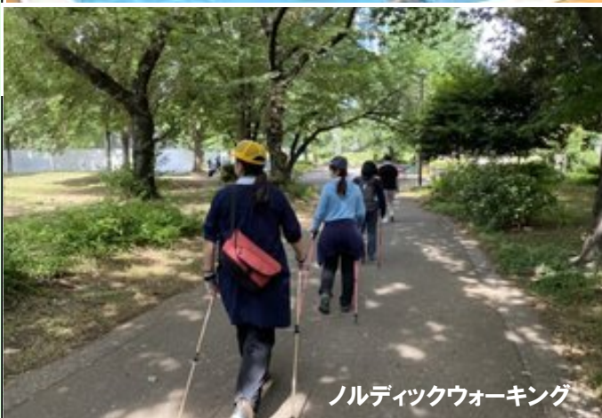
ノルディックウォーキング