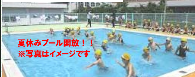
夏休みプール開放！！ ※写真はイメージです