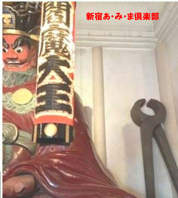
新宿あ・み・ま倶楽部