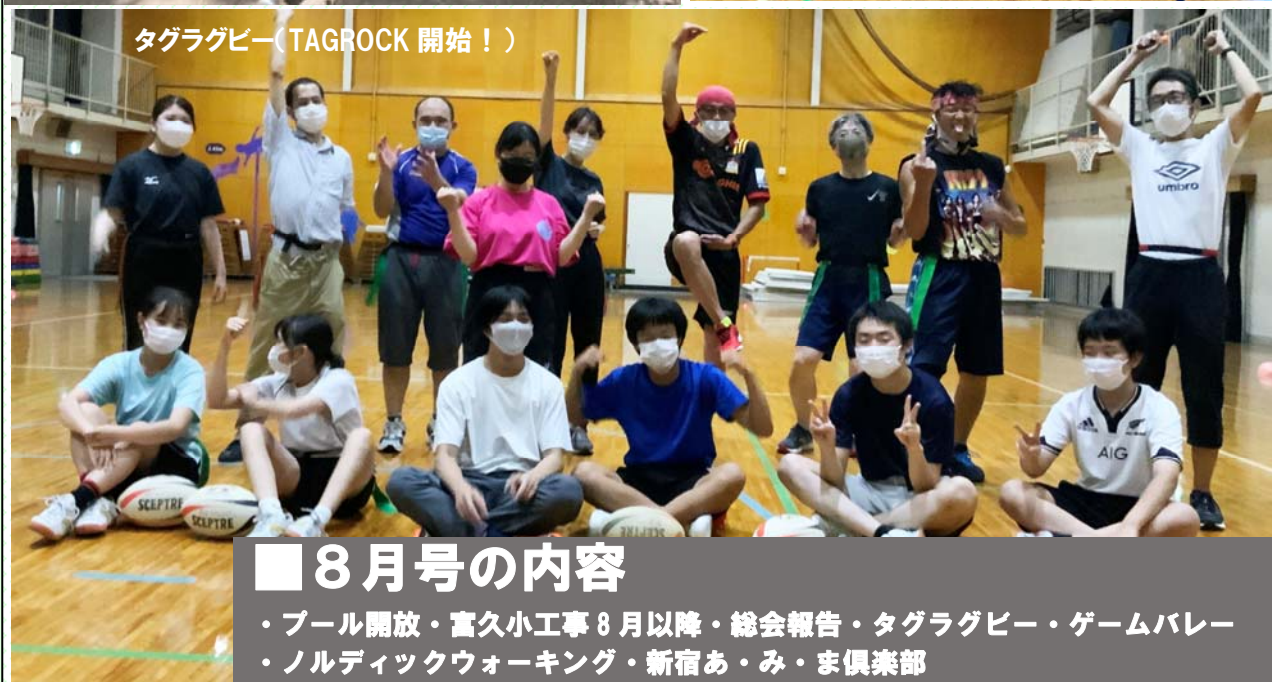
タグラグビー（TAGROCK 開始！）