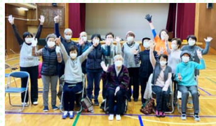
2021年度：レクダンス +ポッチャ体験企画より

「パンデミック」目に見えないものと戦うのは大変です。 日常がどれほどありがたかったか思い知らされました。 ここを乗り越えるには「みんなで」それぞれができることをし て日常が取り戻せたときに自由に飛び立てるよう準備をしま しょう。 コロナの終息が近いことを願います。