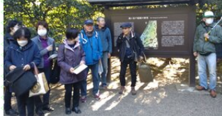
新宿あ・み・まクラブ