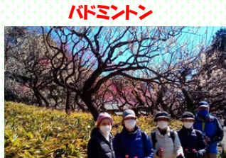
ハルテックウォーキング