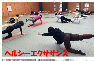
ヘルシーエクササイズ