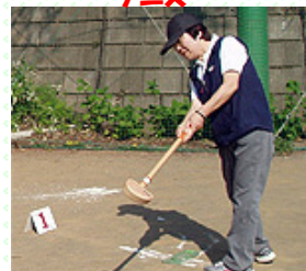
クラウンドゴルフ