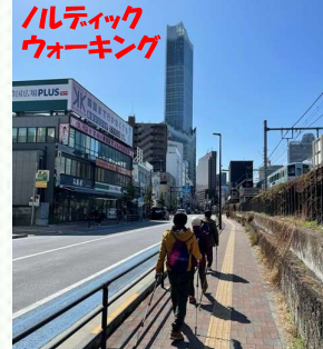
ハルディックウォーキング