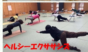
ヘルシーエクササイズ