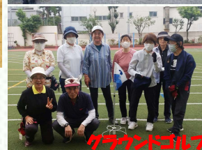
クラウンドゴルフ