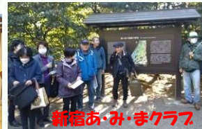
新宿あ・み・まクラブ