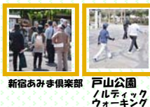
新宿あみき倶楽部 戸山公園ノルディックウォーキング